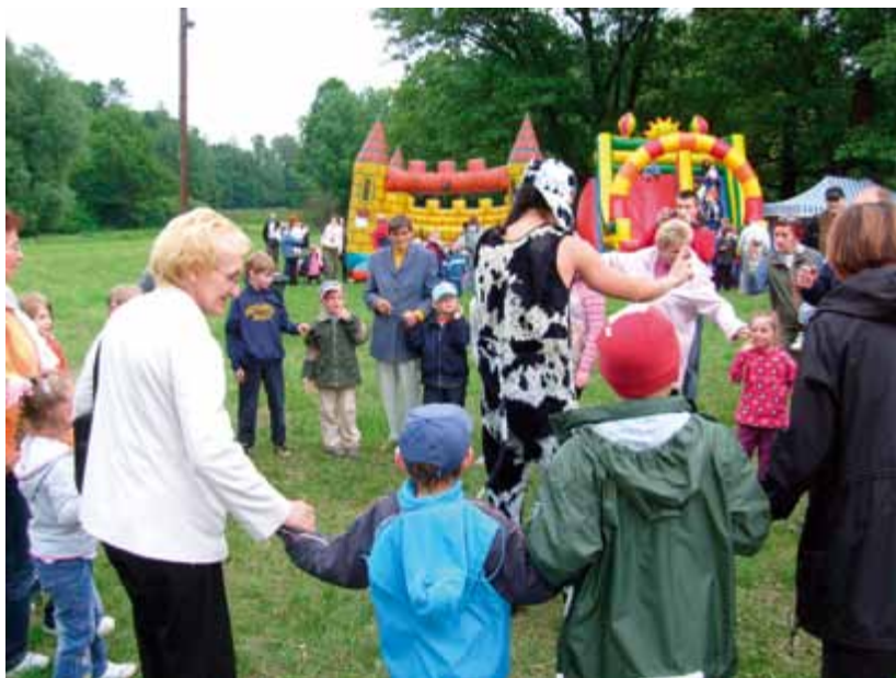
Dzień rodzicielstwa zastępczego 2009