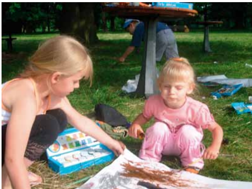
Dzień rodzicielstwa zastępczego 2008