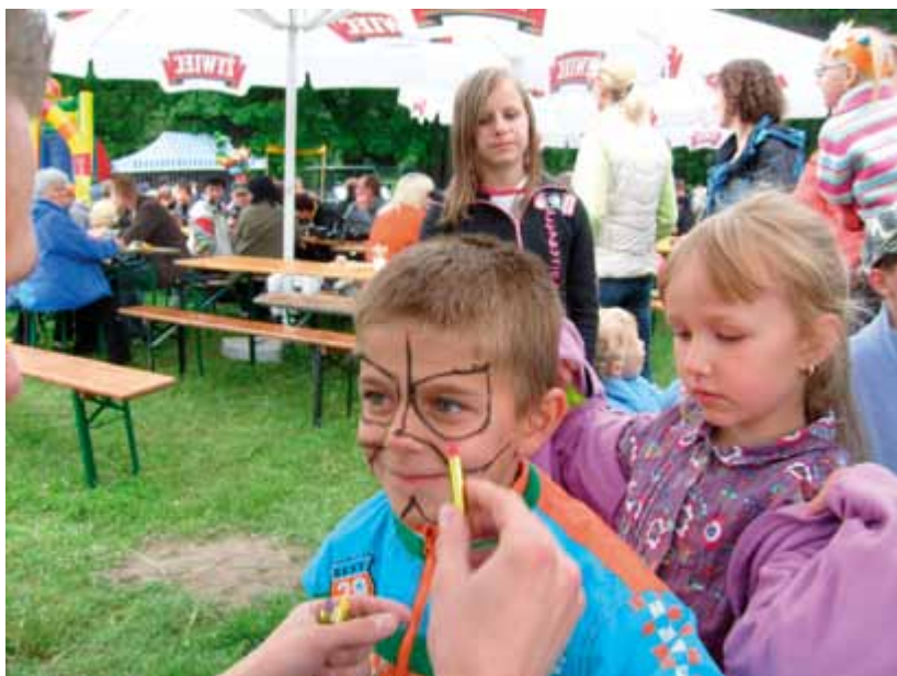
Dzień rodzicielstwa zastępczego 2009