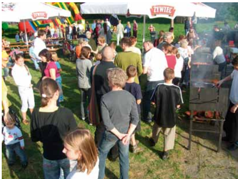
Dzień rodzicielstwa zastępczego 2009