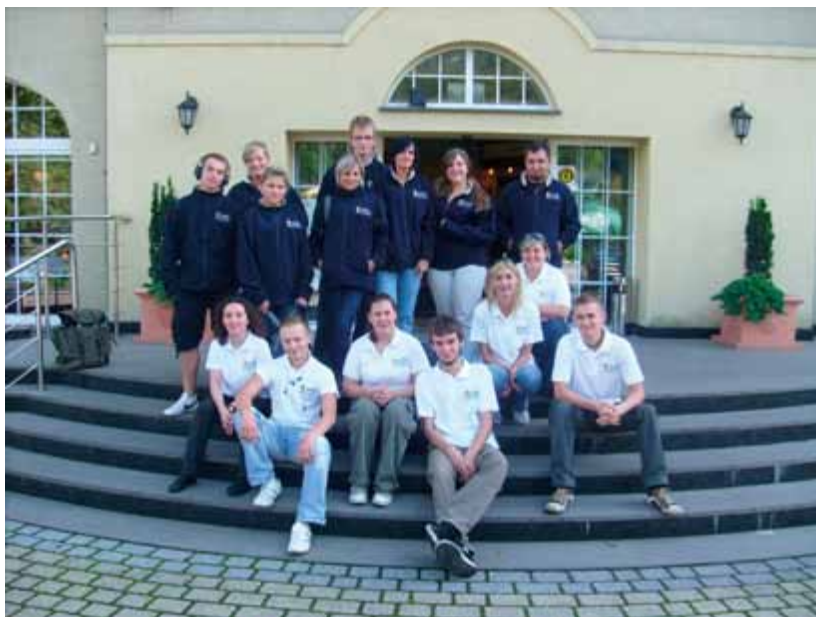
Warsztaty wyjazdowe dla usamodzielniających się wychowanków