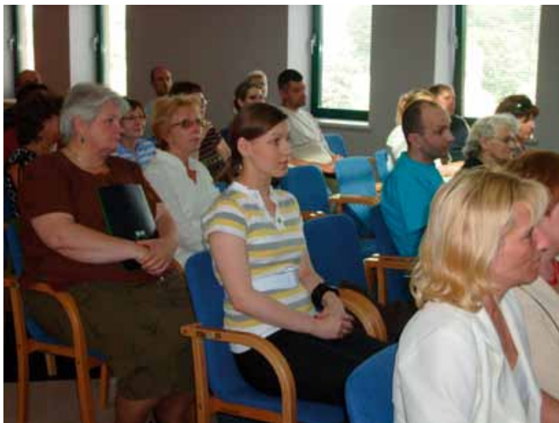
Konferencja Rodzicielstwo zastępcze – od teorii do praktyki 2008