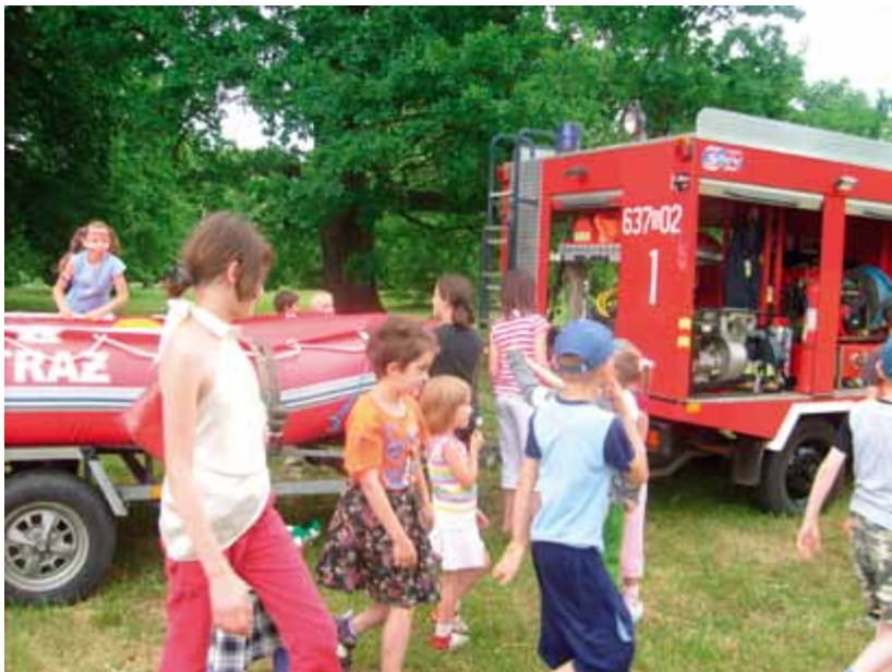
Dzień rodzicielstwa zastępczego 2008