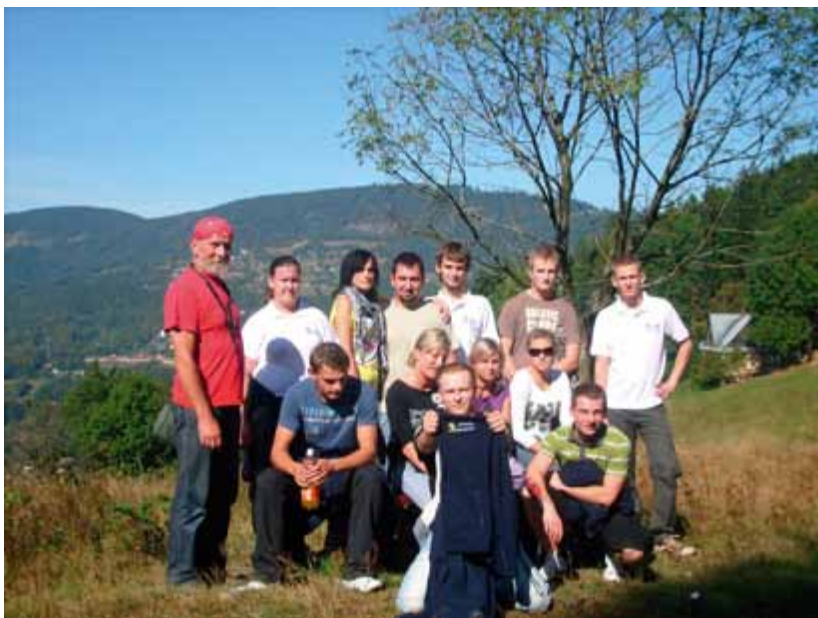
Warsztaty wyjazdowe dla usamodzielniających się wychowanków