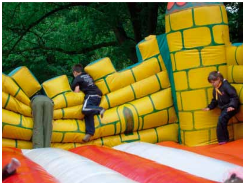
Dzień rodzicielstwa zastępczego 2009