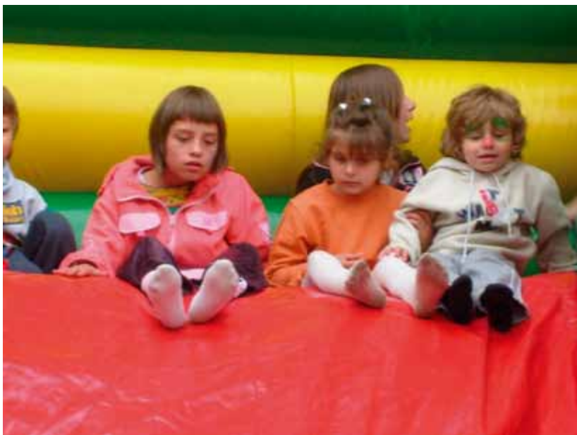
Dzień rodzicielstwa zastępczego 2009