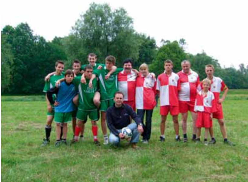
Dzień rodzicielstwa zastępczego 2009