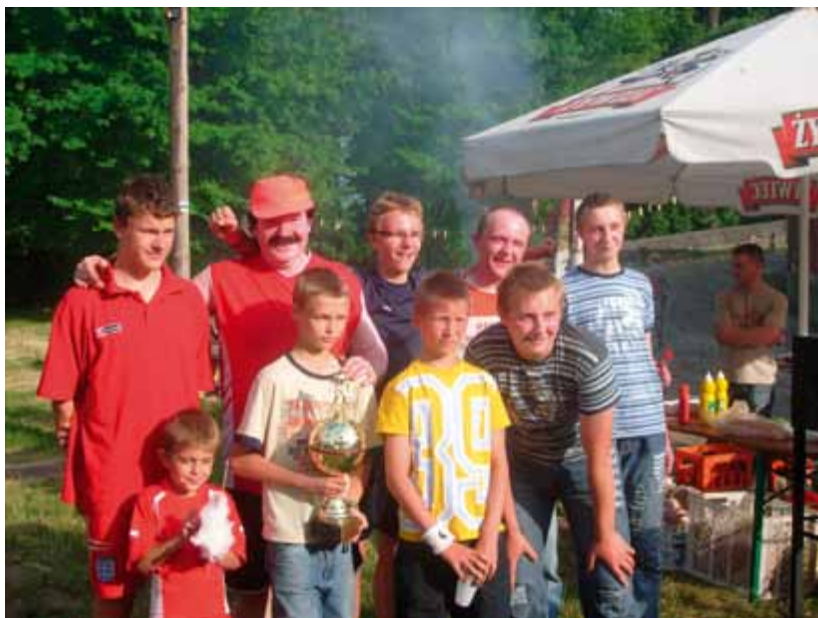
Dzień rodzicielstwa zastępczego 2008