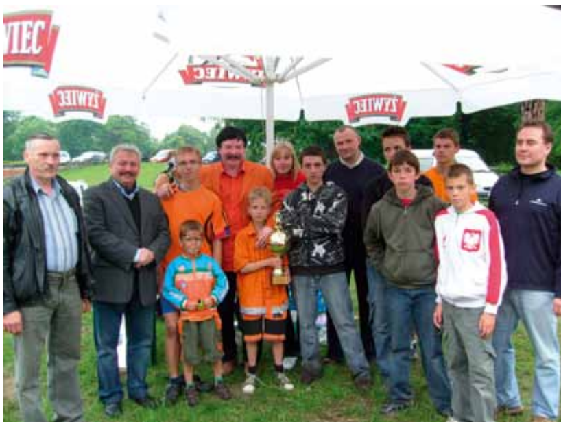
Dzień rodzicielstwa zastępczego 2009