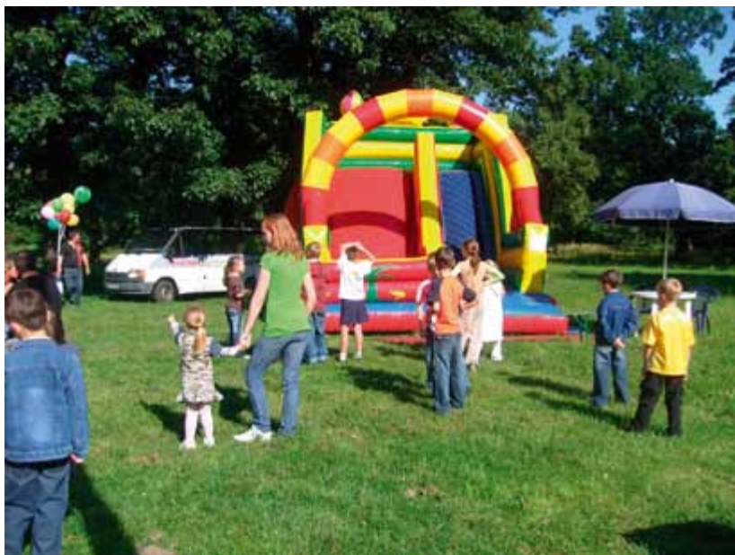
Dzień rodzicielstwa zastępczego 2009