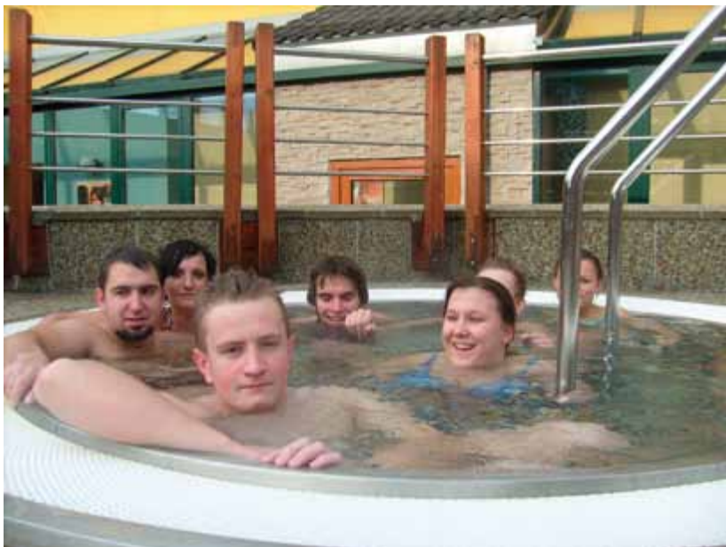
Besenova 2009 – wyjazd z usamodzielniającymi się wychowankami