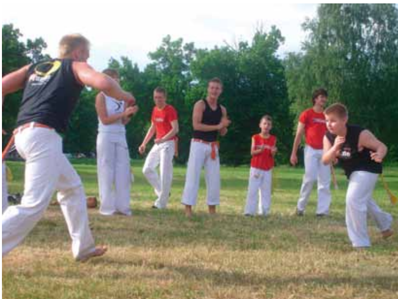
Dzień rodzicielstwa zastępczego 2008