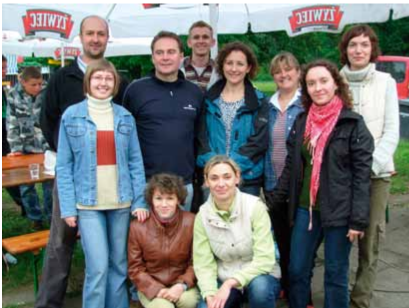
Dzień rodzicielstwa zastępczego 2009